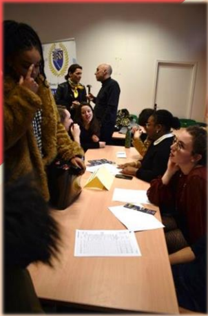
M2 Protection des Droits Fondamentaux et des Libertés - PDF