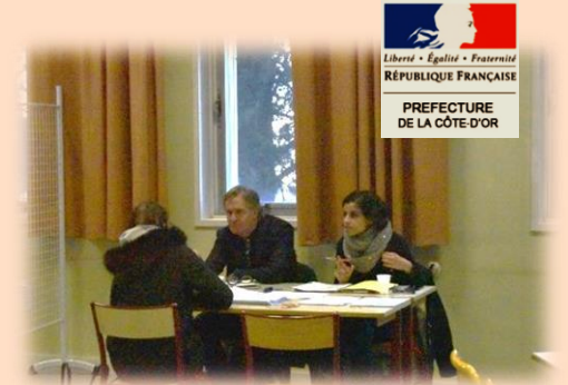
Stand Préfecture Côte d'Or