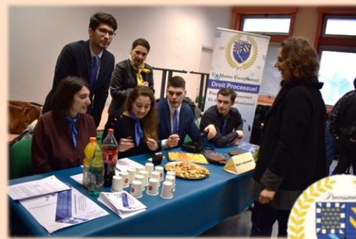
M2 Droit Processuel