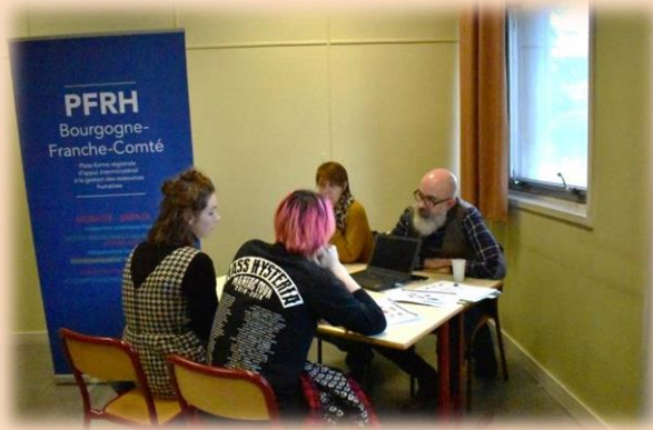
Stand PFRH 21 - Plate-forme d'appui interministériel à la gestion ressources humaines