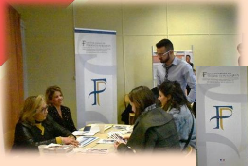
Stand Direction générale des Finances publiques