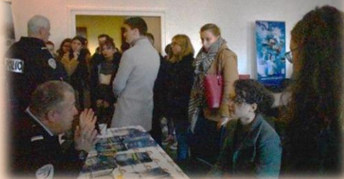
Stand Police nationale