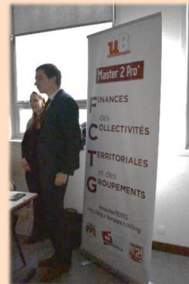
Stand M2 FCTG