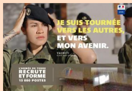
Stand Armée de terre