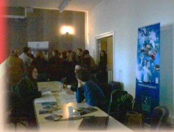
Stand Direction interrégionale des douanes