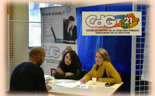
Stand CDG 21 - Fonction publique territoriale